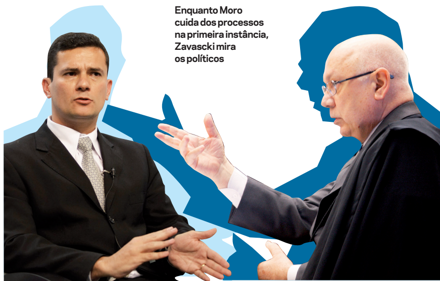
Enquanto Moro cuida dos processos na primeira instância, Zavascki mira os políticos