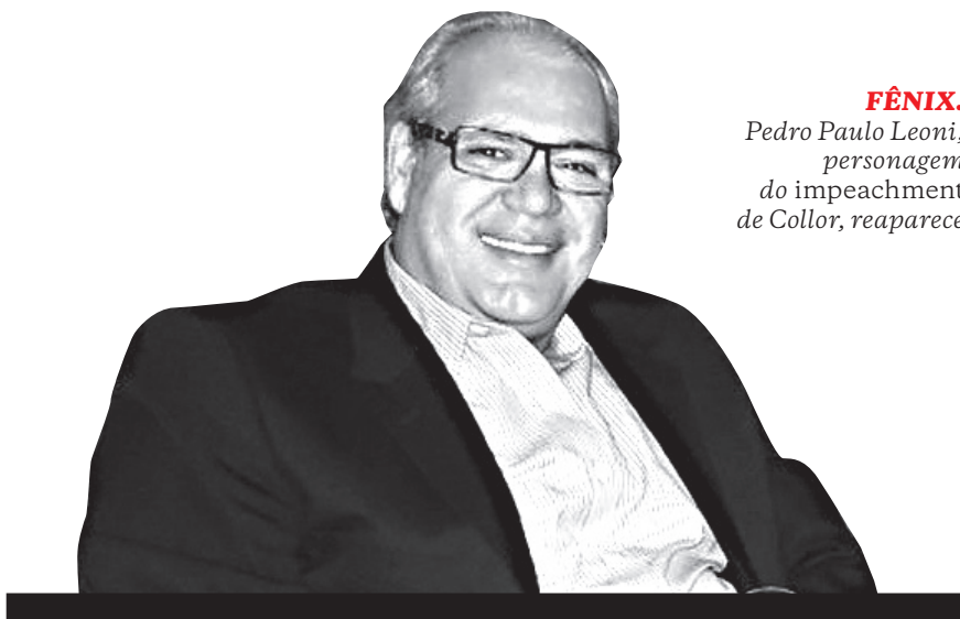
FÊNIX. Pedro Paulo Leoni, personagem do impeachment de Collor, reaparece