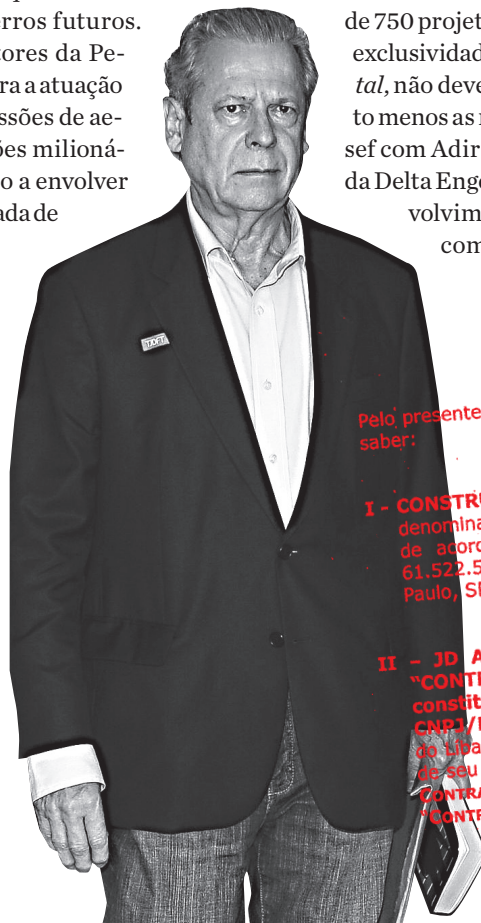
SEMPRE ELE. Dirceu é citado na Lava Jato

Após o recesso de fim de ano, a força-tarefa retomará os trabalhos. Nos bastidores, especula-se que a Polícia Federal realizará ao menos outras dez fases da Lava Jato. A ideia é mudar o nome das operações a partir de agora, com o objetivo de evitar qualquer contaminação em caso de erros futuros. Além de outros setores da Petrobras, estão na mira a atuação do cartel nas concessões de aeroportos e transações milionárias no setor elétrico a envolver as empresas de fachada de