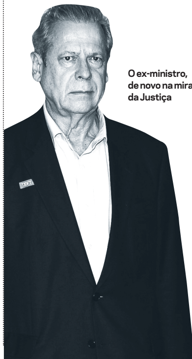
O ex-ministro, de novo na mira da Justiça

Mais que comprovar a relação de Duque com um dos principais pagadores de propinas a atuar nos contratos bilionários da Petrobras, o contrato de compra dos apartamentos na Barra da Tijuca, na visão dos investigadores, contribui para enfraquecer a versão do ex-diretor sobre a total ausência de laços entre ele e Dirceu. Embora tenha sido indicado ao cargo pelo petista e