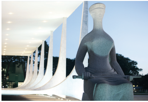
Esta imagem não retrata a Justiça à brasileira