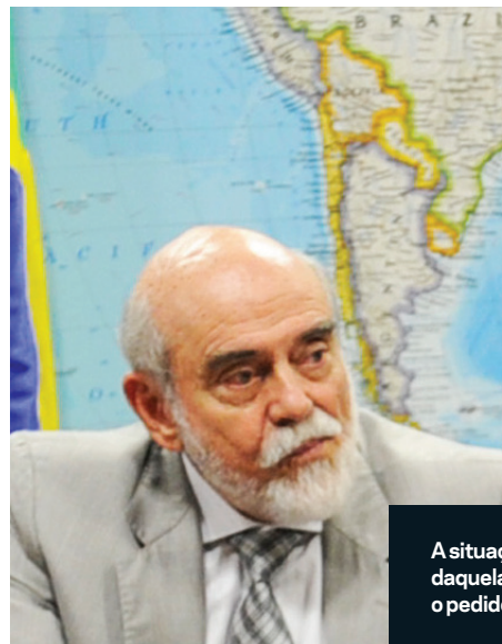
A situação de Dilma é completamente distinta daquela de Collor, define o jurista que assinou o pedido de impedimento do ex-presidente