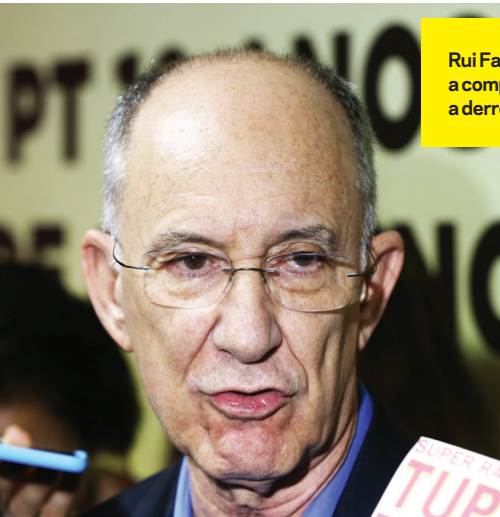
Rui Falcão impediu a completa humilhação, a derrocada final do PT...