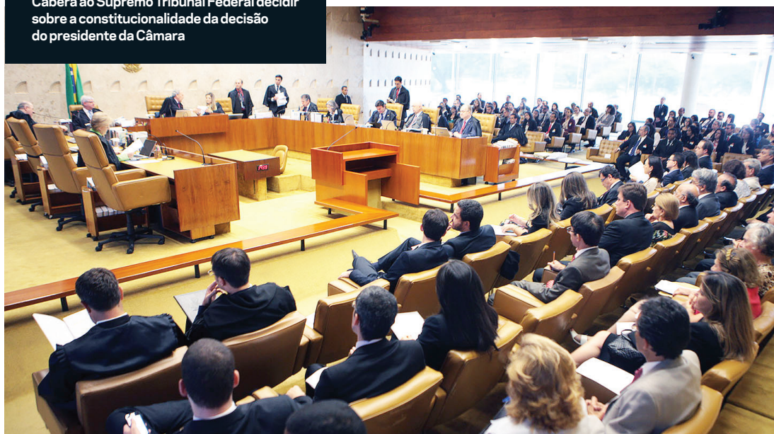
Caberá ao Supremo Tribunal Federal decidir sobre a constitucionalidade da decisão do presidente da Câmara

enviar a peça para julgamento no plenário. Para dar continuidade, seriam necessários os votos de dois terços, ou 342 deputados. Na deposição de Fernando Collor, o trâmite durou menos de um mês. Na hipótese de a Câmara ser favorável à continuidade do caso, Dilma seria afastada por 180 dias do cargo e acabaria julgada pelo Senado em uma sessão presidida pelo presidente do Supremo Tribunal Federal. Como na Câmara, dois terços dos senadores, 54 de 81, precisariam votar a favor do impeachment para destituí-la de vez. Nos Estados Unidos, Bill Clinton enfrentou um processo de impedimento em 1999. Foi absolvido pelo Senado.