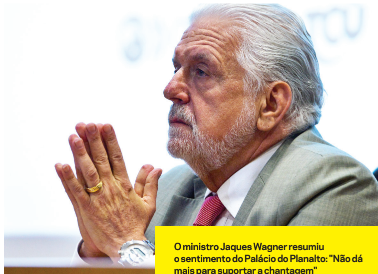
O ministro Jaques Wagner resumiu o sentimento do Palácio do Planalto: "Não dá mais para suportar a chantagem"