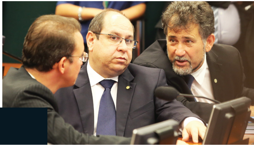
... e tirou das costas dos três deputados do partido o fardo de enterrar a dignidade para salvar o pescoço do peemedebista