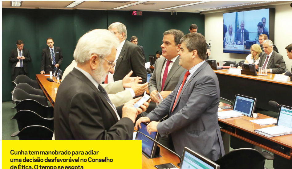
Cunha tem manobrado para adiar uma decisão desfavorável no Conselho de Ética. O tempo se esgota

Dilma Rousseff estava em seu gabinete no Planalto quando soube da decisão do presidente da Câmara. Foi informada por Wagner, avisado com antecedência por aliados no Parlamento, antes de Cunha convocar os jornalistas. A