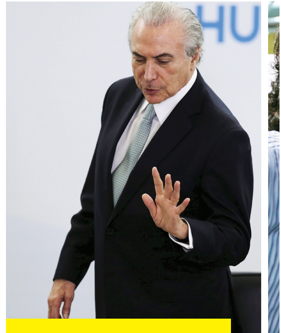
Temer, por enquanto, mantém a expressão de esfinge, embora tenha prometido atuar na defesa do mandato de Dilma Rousseff

Na oposição, sorrisos amarelos. Por meses, o PSDB e seus aliados fizeram vista grossa às estripulias de Cunha enquanto torciam para ele detonar o processo de impeachment . Quando finalmente os desejos oposicionistas se concretizaram, a situação de Cunha havia se tornado moral e politicamente indefensável, em um grau capaz de contaminar a iniciativa tão sonhada. Segundo a mais recente pesquisa