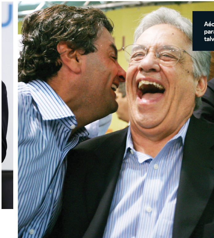
Aécio Neves e FHC: o PSDB não tem motivos para gargalhar. O pedido de impeachment talvez não tenha chegado em boa hora