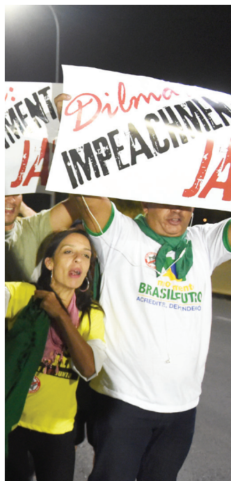
O PSDB quer prolongar o processo para tentar mobilizar a rua a favor da queda da presidenta. O governo deseja apressar o debate