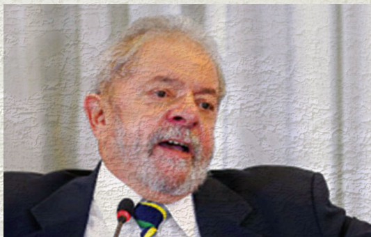
Lula, Calheiros e Aécio Neves. A diversidade de agora visaria encobrir a seletividade de costume?

P.S. 2: Por falar em chantagem, Cunha e os demais investigados do Congresso pretendiam comprar a simpatia do Judiciário com a tramitação em regime de urgência do reajuste salarial de magistrados e servidores. Para Cunha não funcionou. O impacto do mimo até 2019 sobre as contas públicas alcançará 15 bilhões de reais. Os mesmos parlamentares que tramam essa facada no Orçamento acusam Dilma Rousseff de “populismo” e “irresponsabilidade fiscal” por anunciar um aumento de 9% no valor do Bolsa Família.