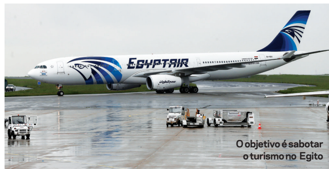
O objetivo é sabotar o turismo no Egito

Dias antes, o “Califado” lançara uma campanha massiva na internet em apoio de sua filial no Sinai. Forçada a recuar na Síria e Iraque, a organização parece ter apostado em ampliar suas bases na África do Norte, onde