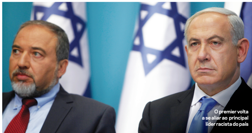
O premier volta a se aliar ao principal líder racista do país