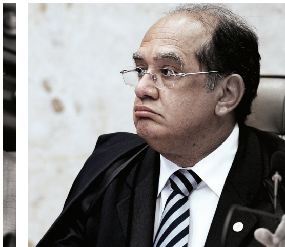
Entre amigos. Gilmar Mendes determinou a suspensão de diligências contra o tucano Aécio Neves

“Fazemos troça. Quando sabemos que o caso é complexo, pedimos para mandar para o Gaeco”, conta aos risos um promotor da capital. Outro integrante do MP paulista diz que o órgão é um aparelho sem utilidade e que ninguém mais tem