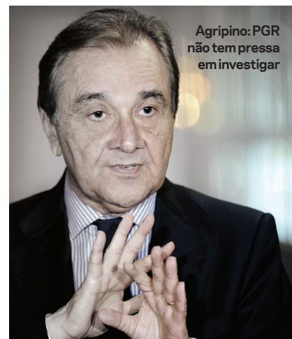
Agripino: PGR não tem pressa em investigar

Jardim. O principal nome apontado no esquema é o do tucano Fernando Capez, presidente da Assembleia Legislativa de São Paulo.