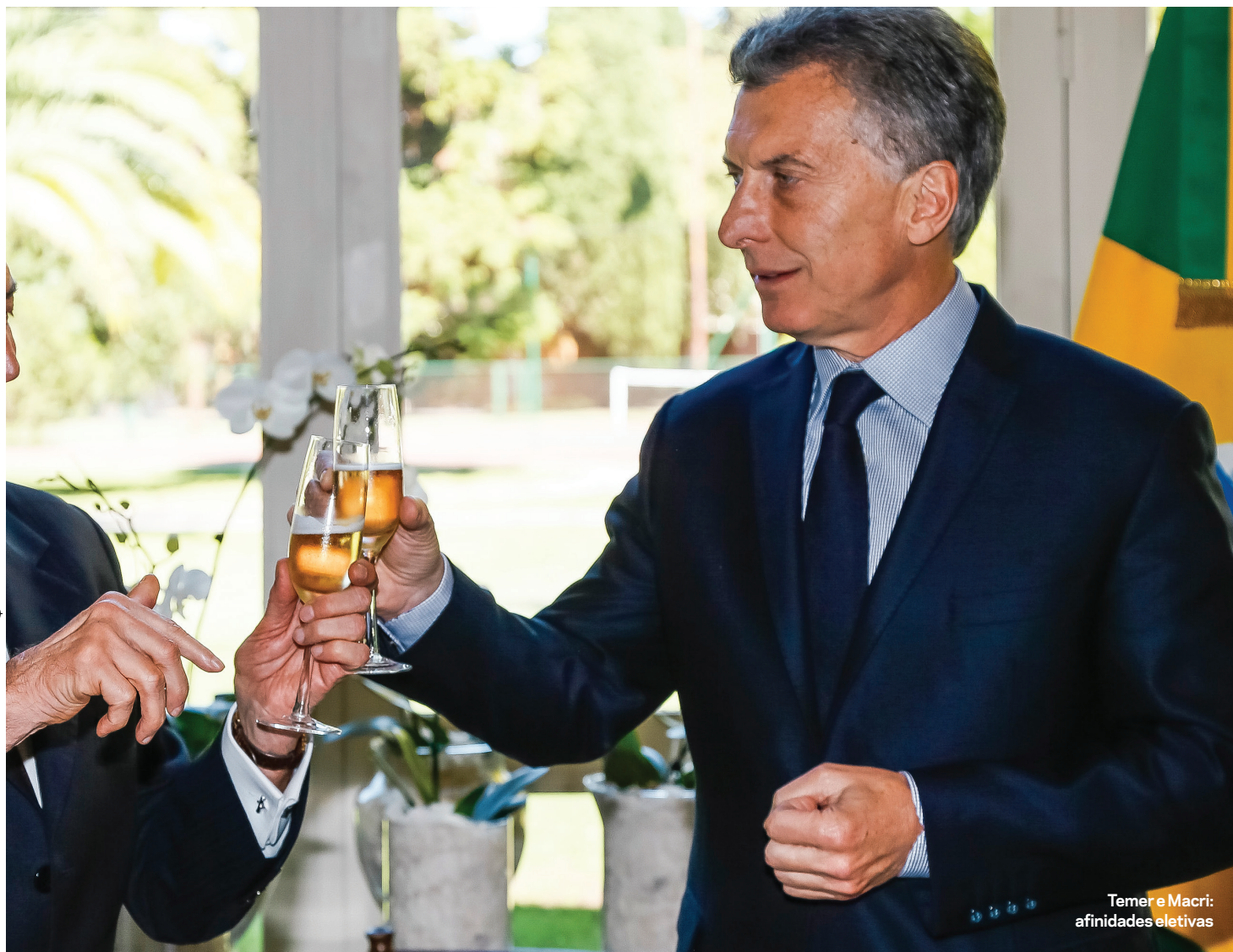
Temer e Macri: afinidades eletivas