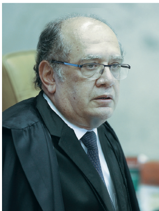
Marco Aurélio prefere ignorar Gilmar Mendes

“Nenhuma democracia merece isso... mesmo no Brasil não merece esse fim”.