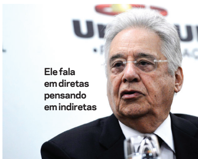
Ele fala em diretas pensando em indiretas