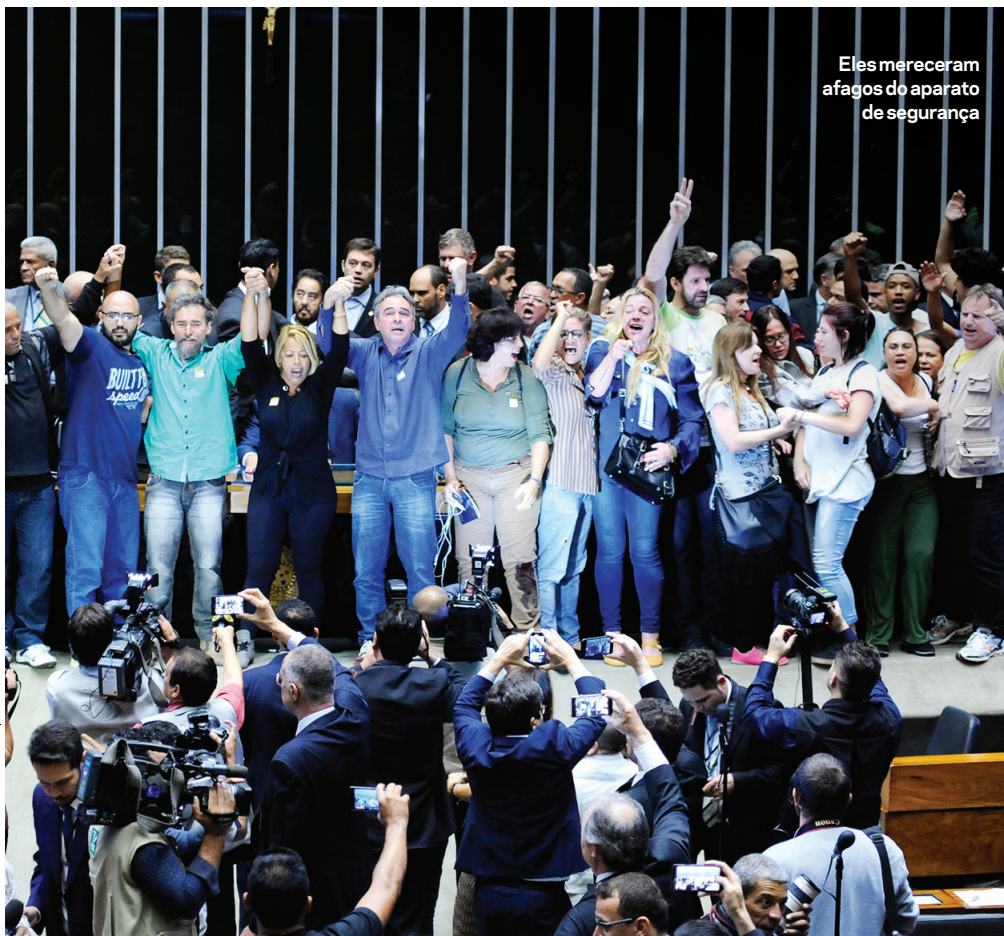
Eles mereceram afagos do aparato de segurança