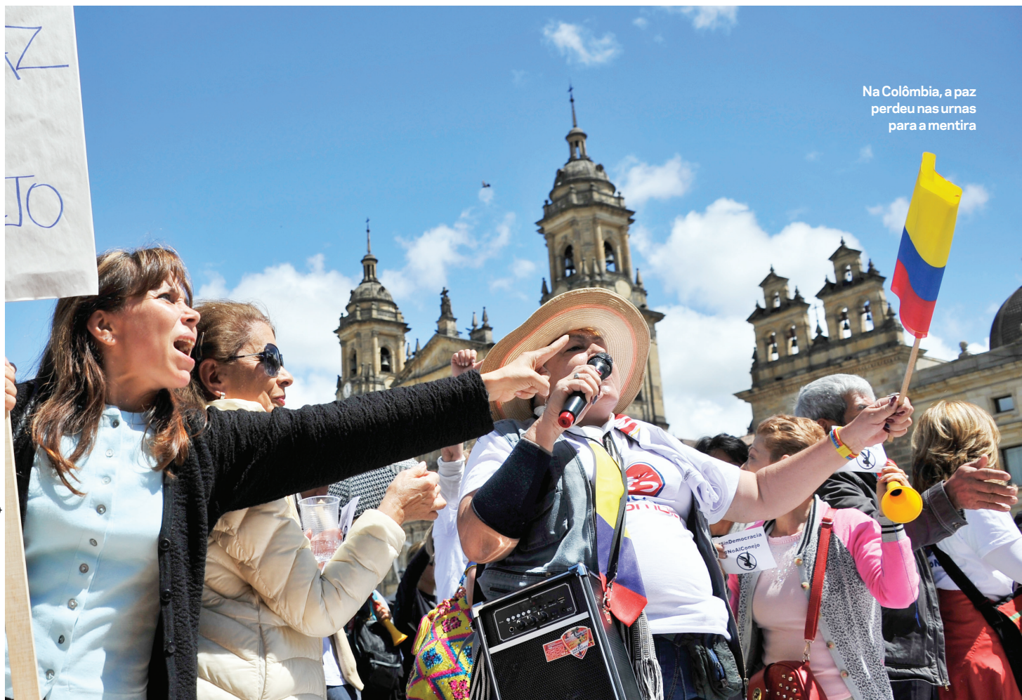
Na Colômbia, a paz perdeu nas urnas para a mentira