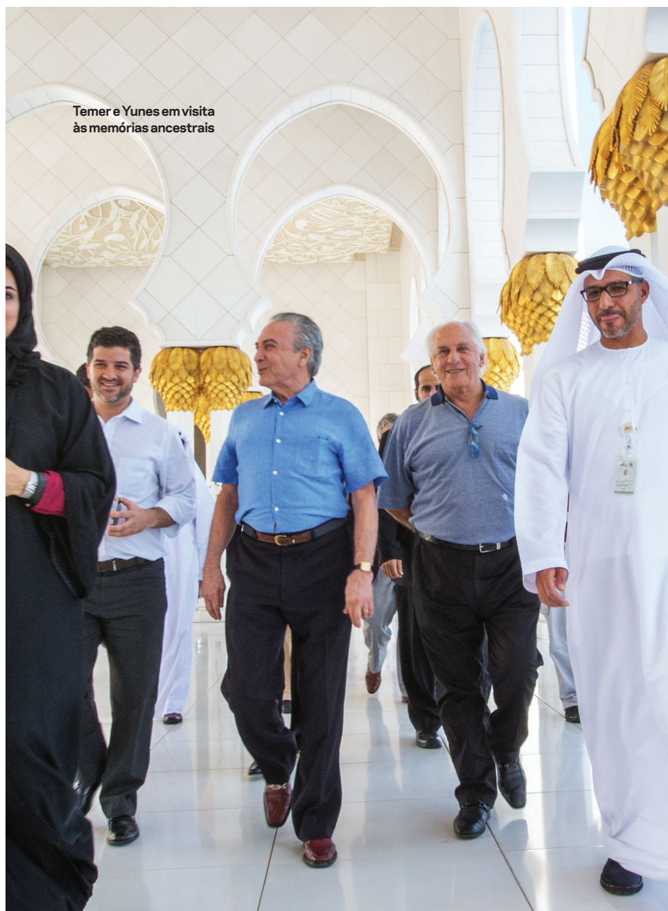
Temer e Yunes em visita às memórias ancestrais