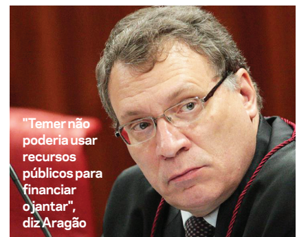
“Temer não poderia usar recursos públicos para financiar o jantar”, diz Aragão

Temer nega ter feito pedidos financeiros a Marcelo e, logo após o primeiro depoimento deste, o Planalto soltou uma nota a dizer que o empresário confirmara o que o presidente “vem dizendo há meses”. Há quem veja Marcelo disposto a preservar-se perante Temer. Entende-se: quer que sua empresa siga de pé, e o governo