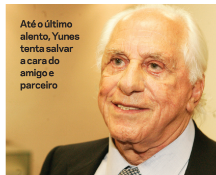
Até o último alento, Yunes tenta salvar a cara do amigo e parceiro

Ao se defender das suspeitas nascidas do jantar, Temer diz que todas as doações da Odebrecht ao PMDB foram legais e registradas. Será? Skaf, o presidente da