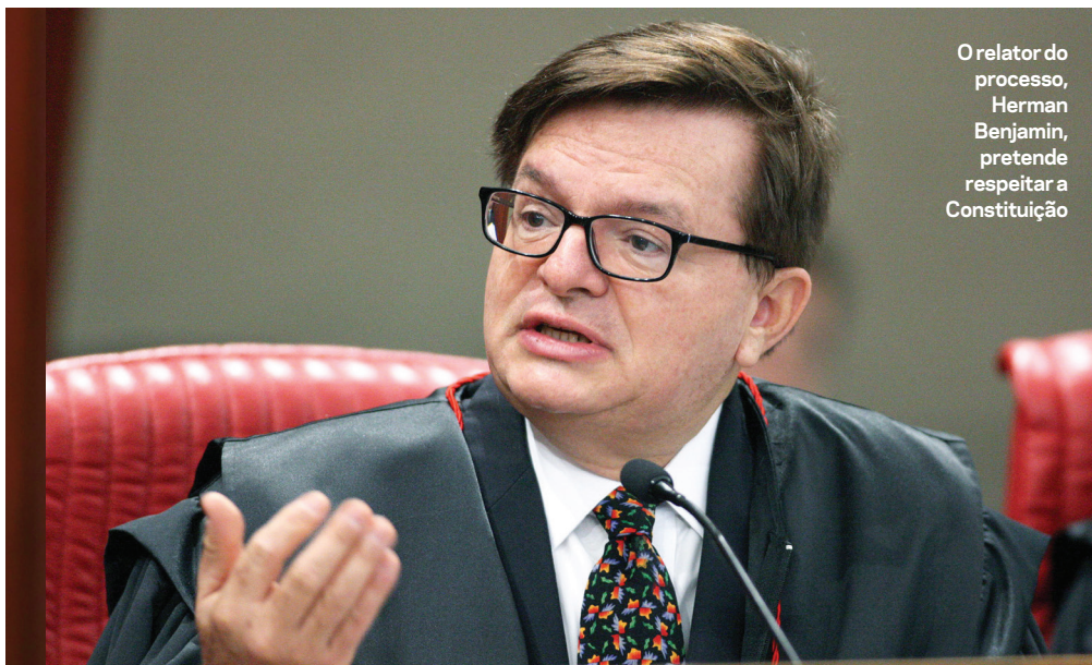
O relator do processo, Herman Benjamin, pretende respeitar a Constituição

pode ajudar ou atrapalhar. Por exemplo: o grupo tem 500 milhões de dólares a receber em crédito do BNDES por obras no exterior, e em março o banco emitiu sinais favoráveis. Outro exemplo: subordinada a Temer, a Advocacia-Geral da União tenta o bloqueio judicial de certos bens da Odebrecht, apesar do acordo de leniência do grupo com o Ministério Público.