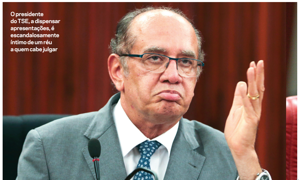
O presidente do TSE, a dispensar apresentações, é escandalosamente íntimo de um réu a quem cabe julgar

O uvido na Quarta-Feira de Cinzas por teleconferência desde Curitiba, onde está em cana, Marcelo reconheceu a ocorrência do jantar. Temer fez o mesmo no dia seguinte, em outra nota do Planalto, aspecto não abordado naquela nota de dezembro. O laconismo presidencial sobre o convescote no Jaburu talvez se explique por um motivo pouco notado. Usar prédio público para pedir verba de campanha a uma empresa que tem contratos com o Estado pode ser enquadrado como “concussão”, crime descrito no artigo 316 do Código Penal: valer-se da função ocupada para exigir vantagem indevida para si ou terceiros, punido com prisão de dois a oito anos. “O candidato morava no Jaburu, mas não poderia fazer um jantar com recursos públicos e pedir dinheiro usando o status de vice-presidente, o símbolo da Vice-Presidência,