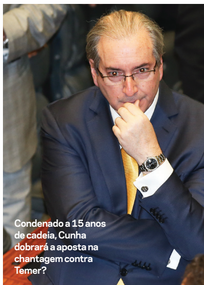
Condenado a 15 anos de cadeia, Cunha dobrará a aposta na chantagem contra Temer?

DOS 10 MILHÕES, 6 SOBRARIAM PARA PAULO SKAF, CANDIDATO AO GOVERNO DE SÃO PAULO, ACUSA MELO FILHO