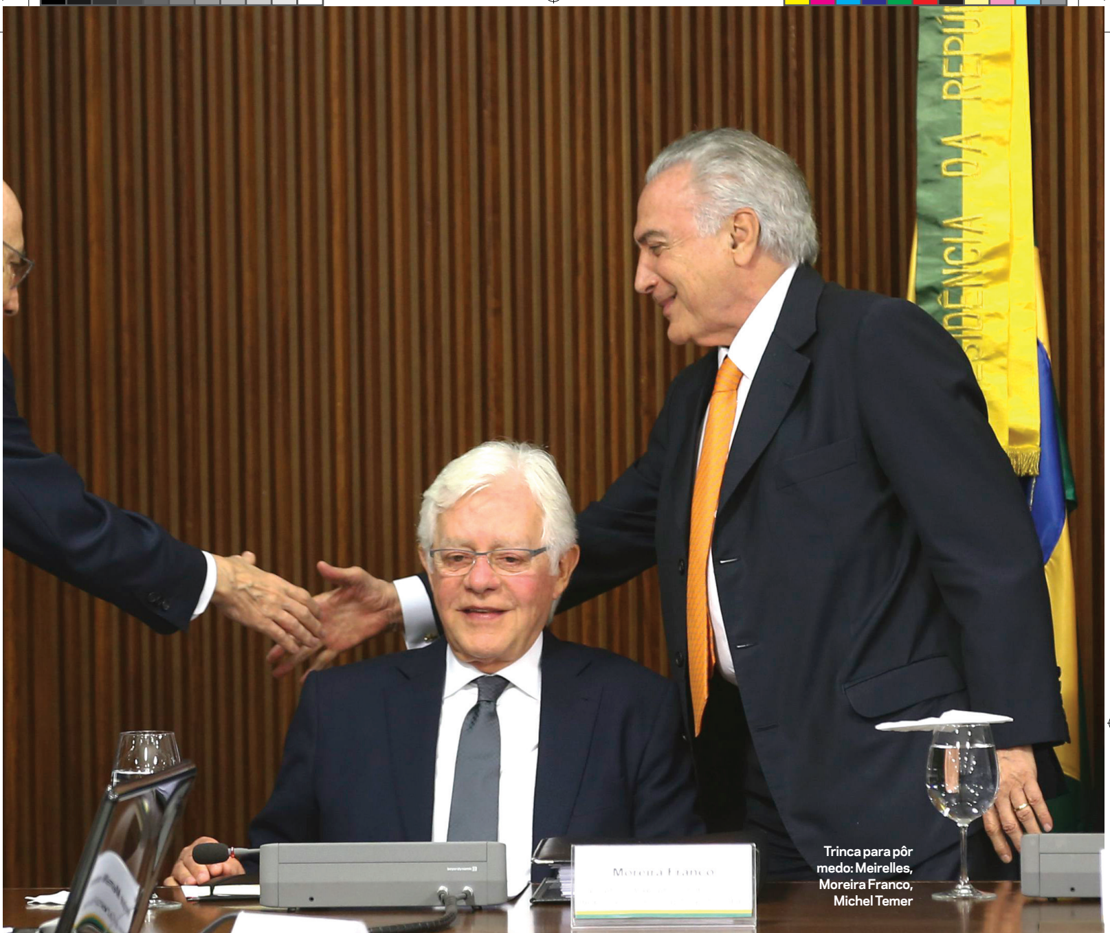
Trinca para pôr medo: Meirelles, Moreira Franco, Michel Temer