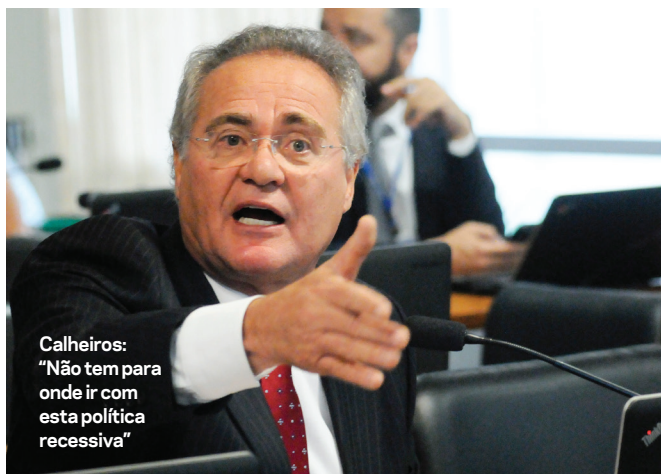
Calheiros: "Não tem para onde ir com esta política recessiva"