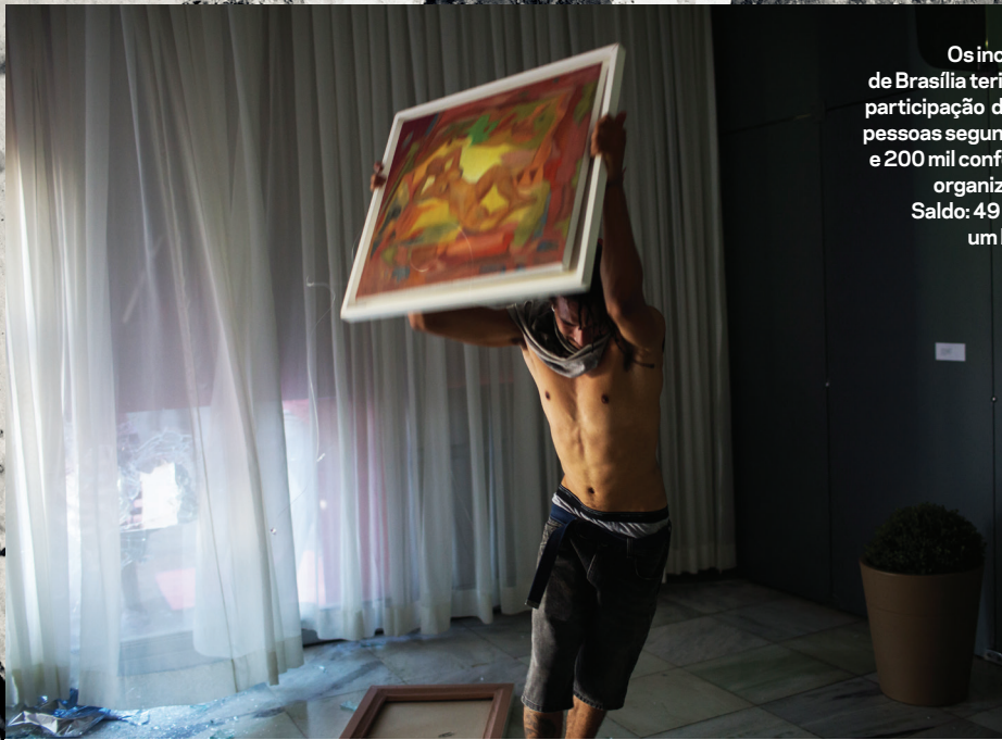
Os incidentes de Brasília teriam uma participação de 25 mil pessoas segundo a PM e 200 mil conforme os organizadores. Saldo: 49 feridos, um baleado