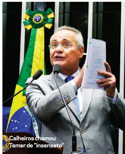
Calheiros chamou Temer de "insensato"

semana. "Espero que a notícia não seja verdadeira", comentou em uma sessão do STF o ministro Marco Aurélio Mello. Mas era, anunciada pelos ministros da Defesa, Raul Jungmann, e do Gabinete de Segurança Institucional (GSI), general Sergio Etchegoyen. Uma história estranha. O Planalto justificou-se assim: