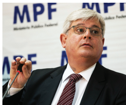
O xerife foi bem camarada com os irmãos Batista e se tornou, como será provado, a pedra no sapato de Temer, a sombra da eleição de um novo procurador-geral

O ministro da Fazenda do governo sem voto, defensor das reformas radicais, “avisa” intramuros que continua no cargo mesmo com outro presidente, um desvario tecnocrata. Em teleconferência com uma turma do banco JP Morgan, foi além e comentou que as reformas também seguem, não importa quem esteja no leme