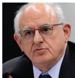
Nelson Jobim recusa-se a ser candidato na indireta

Se o clamor por Diretas Já crescer nas ruas, "não teremos como segurar", comentou com um colega o deputado Felipe Maia, do DEM do Rio Grande do Norte. O líder do partido no Senado, Ronaldo Caiado, defende a ideia. "Eu não tenho medo das ruas, eu não acredito em Colégio Eleitoral", disse da tribuna na Esplanada.