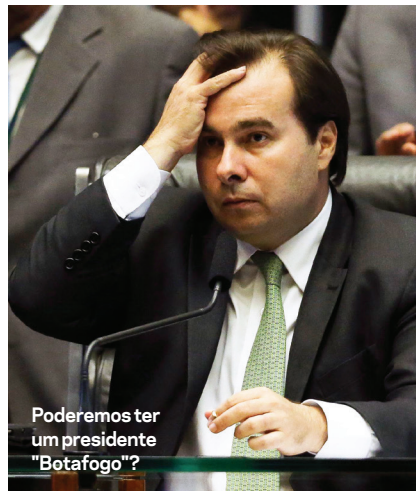
Poderemos ter um presidente “Botafogo”?

A troca de comando na PGR é prenúncio de uma guerra total “Janot vs. Temer”. Se nocautear o presidente, o