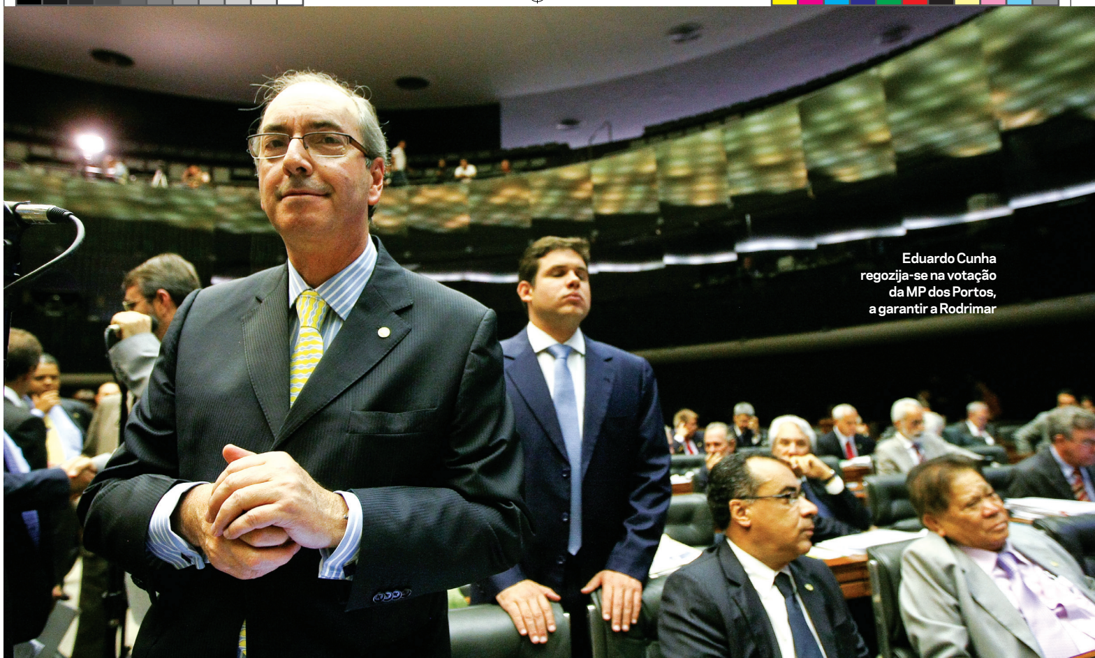
Eduardo Cunha regozija-se na votação da MP dos Portos, a garantir a Rodrimar