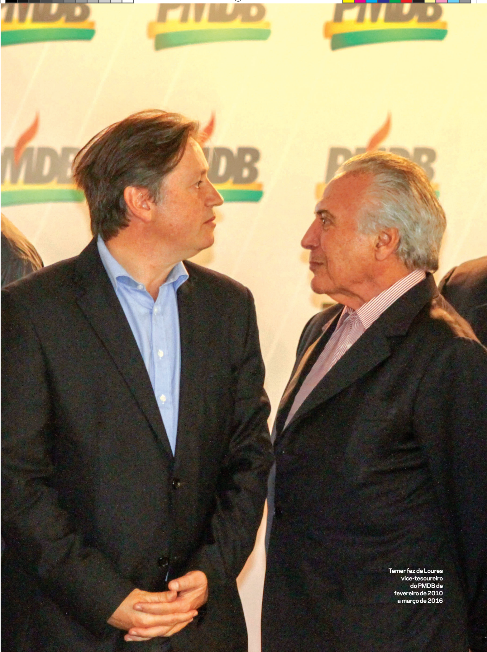
Temer fez de Loures vice-tesoureiro do PMDB de fevereiro de 2010 a março de 2016