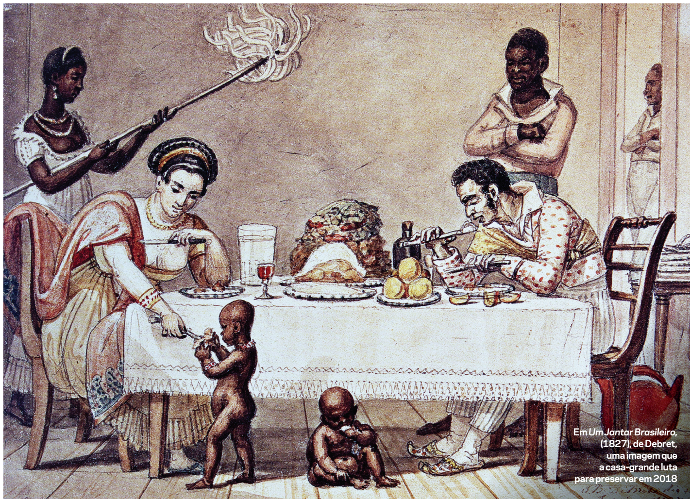
Em Um Jantar Brasileiro , (1827), de Debret, uma imagem que a casa-grande luta para preservar em 2018

ELVIRA LOBATO (Em Antenas da Floresta - A Saga das TVs da Amazônia , Ed. Objetiva)