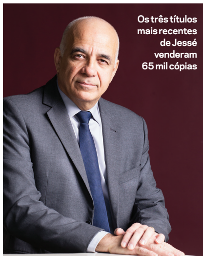
Os três títulos mais recentes de Jessé venderam 65 mil cópias

Imodesto, Jessé admite o desejo de fixar um novo paradigma no pensamento sociológico brasileiro, que explique nossa histórica desigualdade social em razão não mais da corrupção, como prefere o pensamento