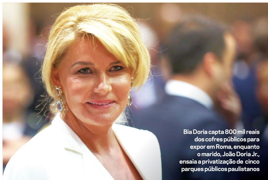
Bia Doria capta 800 mil reais dos cofres públicos para expor em Roma, enquanto o marido, João Doria Jr., ensaia a privatização de cinco parques públicos paulistanos

O prefeito de São Paulo, João Doria Jr., está em vias de privatizar cinco parques municipais (incluindo o Ibirapuera), praças e planetários, além dos mercados municipais da capital paulista. Mas a ideia de conceder à iniciativa privada a primazia das gestões dos recursos públicos não encontra eco em sua própria