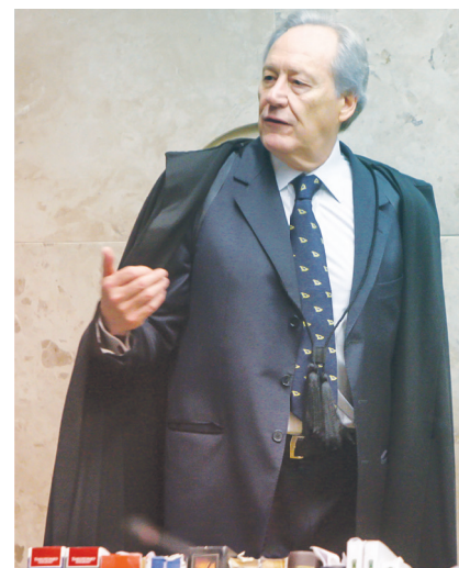
Toffoli, Gilmar Mendes e Lewandowski são agora a pedra no sapato de Moro, de quem Mendes já disse: “Esse sujeito fala com Deus?” Teori Zavascki condenou a divulgação da conversa de Lula com Dilma. No Roda Viva , o inquisidor curitibano esclareceu: “Pedi escusas pela controvérsia gerada, jamais a respeito da divulgação daqueles áudios”