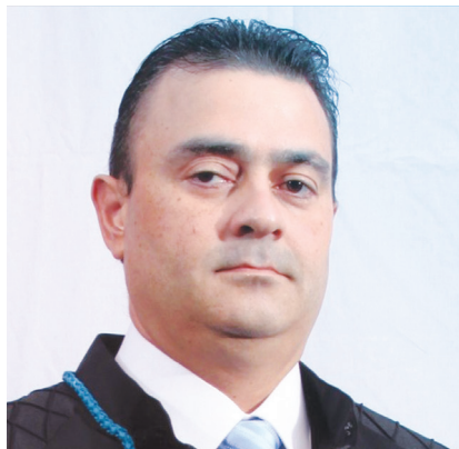
Ney Bello, juiz do TRF1: não é razoável que um juiz se arvora a competente e decida por conta própria sem esperar a decisão da Corte superior

Moro e a esposa, Rosângela, são retratados como exemplos. O casal é parente de desembargadores. Advogada, Rosângela é prima do prefeito de Curitiba, Rafael Greca, ambos descendentes de um capitão, Manoel Ribeiro de Macedo, “preso pelo primeiro presidente da Província do Paraná por acusações de corrupção e desvio de bens