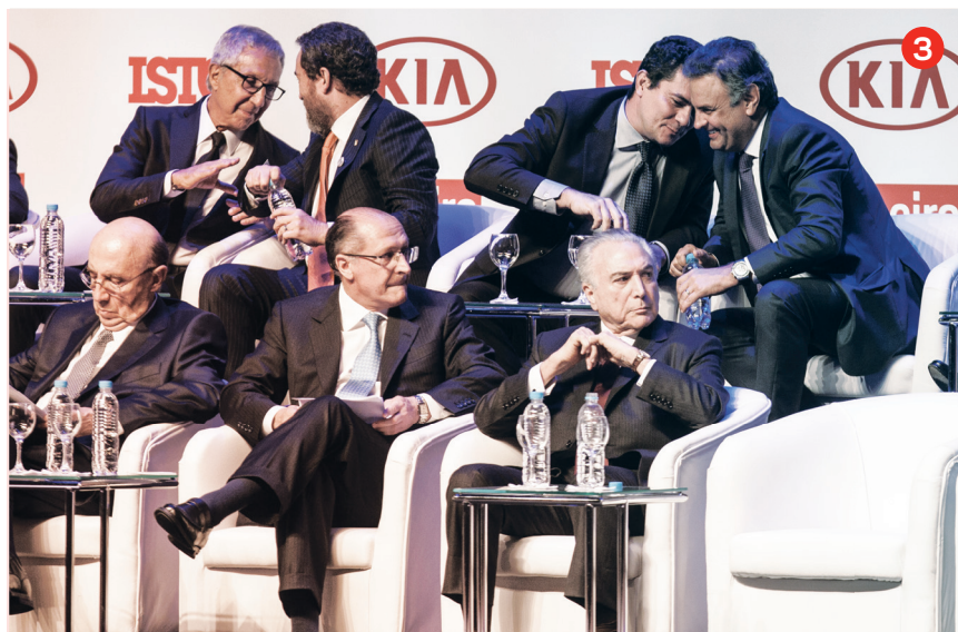
1 Moro com a esposa, Rosângela. 2 Em glória, no Roda Viva. 3 Na festança golpista, em conversa com o réu Aécio. 4 Alegres medidas com o presidente ilegítimo. 5 Ao lado de João Roberto Marinho, ao receber o prêmio da Globo por um desempenho que tanto agrada aos donos da emissora. 6 Assistente do filme que faz dele um herói, ao lado de Marcelo Bretas, de quem se tornou inimigo. 7 Entrada teatral em evento idem.