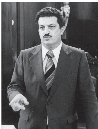
Nenhuma semelhança entre este senhor e os atuais carcereiros de Lula

É tanta confusão, que talvez nem Sergio Moro, o onipotente, seja capaz de resolver. •