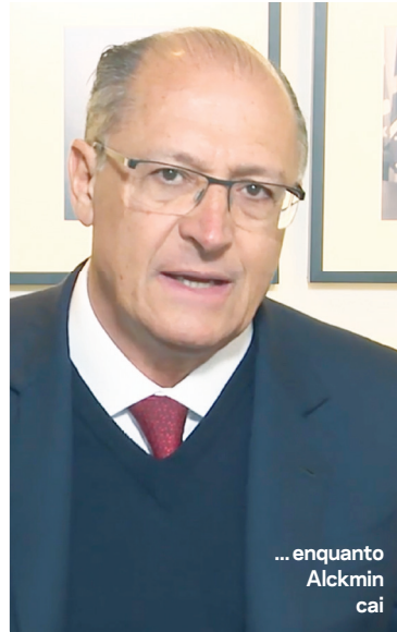
... enquanto Alckmin cai