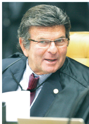
A voz é do locutor ou do ministro?

O disparo tem Lula na mira. Quem pagou o marqueteiro? Luiz Fux, presidente do TSE, avalizou?