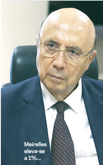
Meirelles eleva-se a 1%...