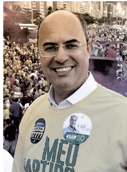
EVERTON DANTAS. REPRODUÇÃO/MÍDIA SOCIAL E LUIS IVO