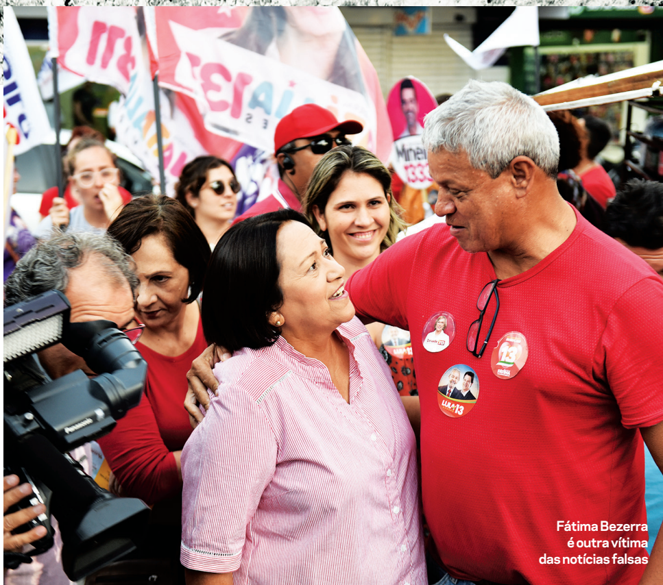
Fátima Bezerra é outra vítima das notícias falsas

pode colher resultado inverso ao esperado. No Rio, a vantagem de Witzel era enorme, mas está se estreitando. Talvez não seja o suficiente para mudar o desfecho que parecia anunciado, mas há claramente uma mudança em curso.”