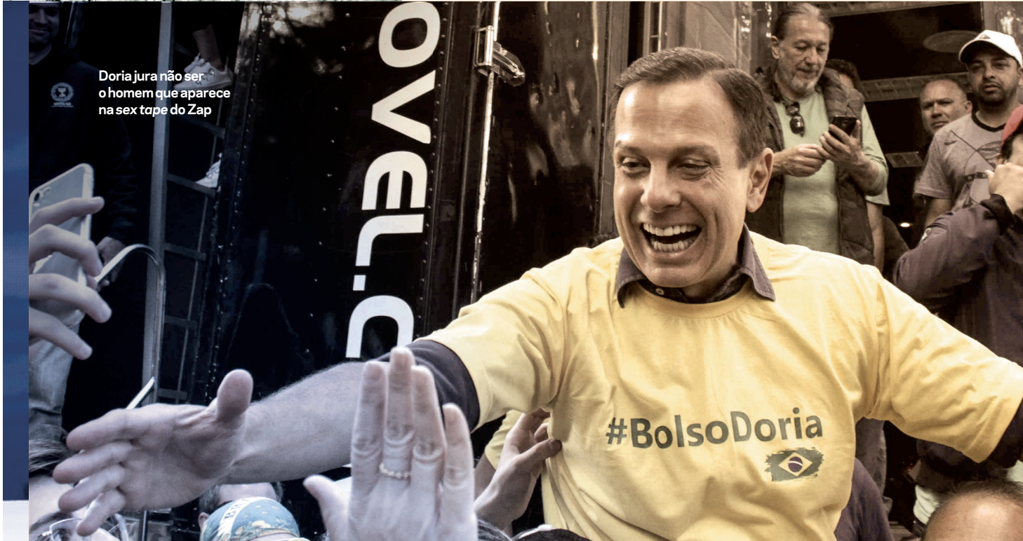
Doria jura não ser o homem que aparece na sex tape do Zap