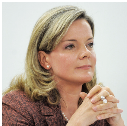
Gleise. “Qual é o crime que Lula cometeu? Lavagem de dinheiro de quem e onde? Isso é mais uma peça de teatro”

(A título de compensação, um parêntese. Aprecie com moderação esta abertura de matéria de Gerson Camarotti para a revista Época em fins de 2002, quando