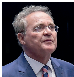
A resolução favorece a eleição de Renan Calheiros no Senado