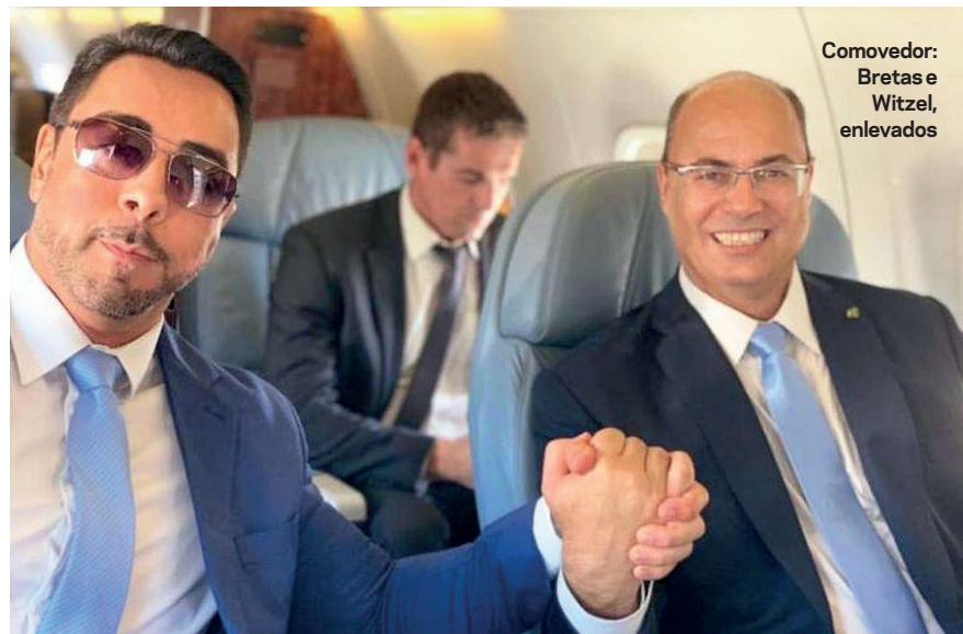
Comovedor: Bretas e Witzel, enlevados

Certo é que a dupla Flávio e Queiroz não cansa de surpreender, e a mídia não dá trégua. O filho de Bolsonaro era