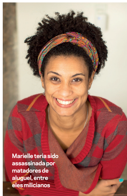
Marielle teria sido assassinada por matadores de aluguel, entre eles milicianos