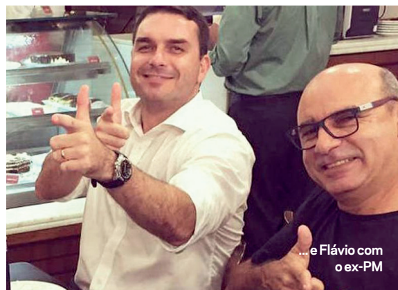
...e Flávio com o ex-PM