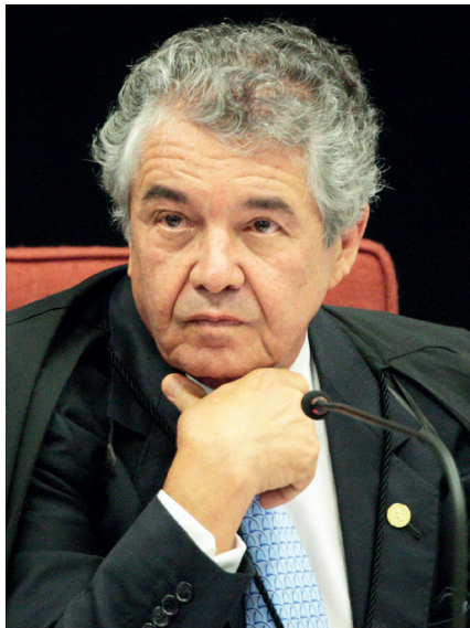
Marco Aurélio Mello alfineta Luis Fux, autor da liminar a favor de Flávio

mandatos eletivos? O patrimônio declarado do quarteto à Justiça Eleitoral é de 6 milhões de reais. O grosso é de imóveis, aquele ramo em que a milícia de Rio das Pedras se meteu. Reportagem de um ano atrás da Folha mostrou que, em valores de mercado, os imóveis do clã valem 15 milhões. Entre a primeira vez que conquistou um mandato (2002), aos 21 anos, e eleger-se senador (2018), os bens de Flávio passaram de 25 mil reais (um carro Gol) para 1,7 milhão, dos quais 1 milhão em imóveis na Barra da Tijuca, vizinha de Rio das Pedras.