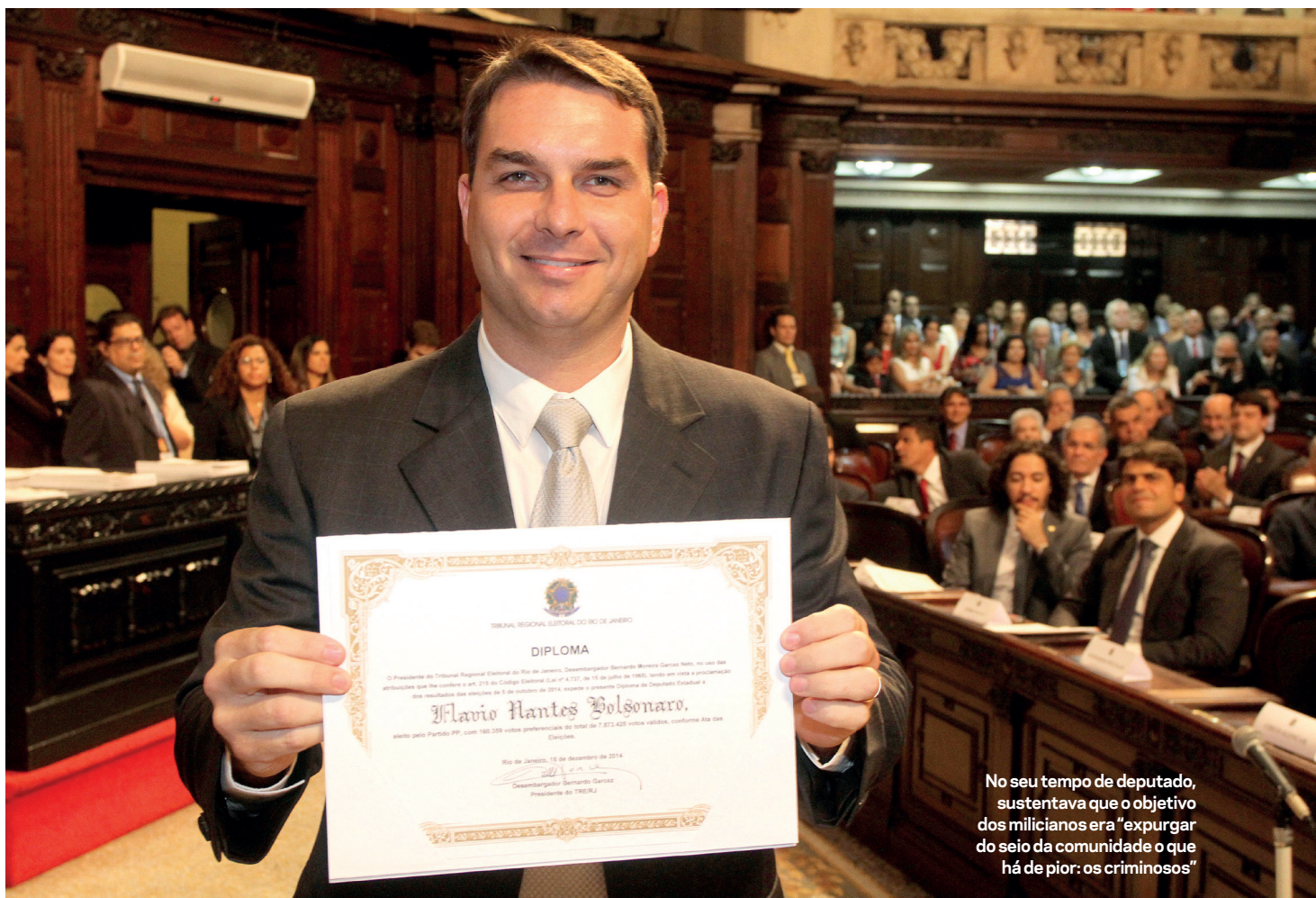
No seu tempo de deputado, sustentava que o objetivo dos milicianos era “expurgar do seio da comunidade o que há de pior: os criminosos”

quadrilha e homicídio. Tiveram a prisão preventiva decretada e cinco foram em cana. Os demais sumiram. É longa a lista de crimes imputados à rapaziada. Recepção de carga roubada, uso de lanças para esconder produto de assaltos, porte e posse ilegal de armas, extorsão de moradores e comerciantes com a cobrança de taxa de proteção, suborno de agentes públicos, agiotagem e, principalmente, construção, venda e aluguel de imóveis (ramo pelo qual Flávio tem paixão) em áreas griladas.