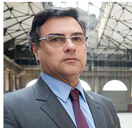
Gussem avisa: é possível haver denúncia à Justiça, mesmo sem Flávio e Queiroz deporem

M arinho será o herdeiro da vaga no Senado, caso o pior aconteça com Flávio. Pode acontecer? De Davos, na Suíça, Jair Bolsonaro deu uma declaração reveladora do espírito dentro de um governo desgastado pelo episódio. “Se, por acaso, ele errou e isso ficar provado, eu lamento como pai, mas