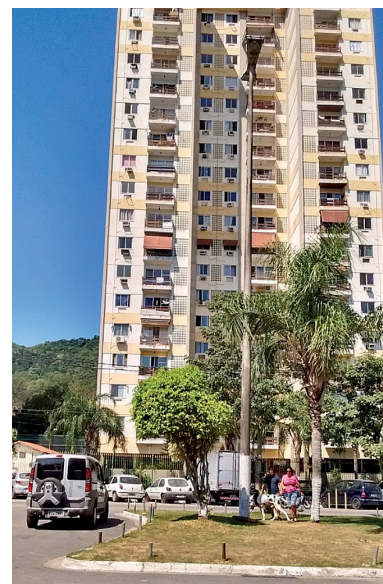
A Operação Intocáveis, dos 13 procurados, conseguiu prender 5, enquanto apreendem armas e valores no edifício da Barra