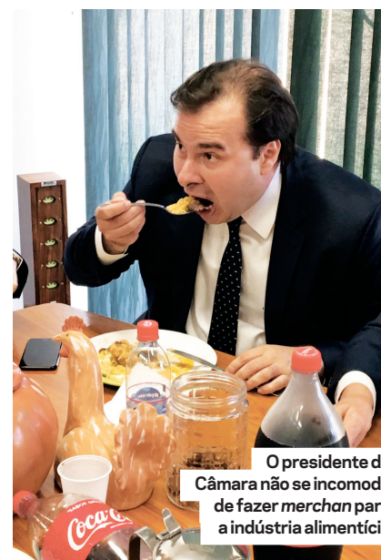
O presidente da Câmara não se incomoda de fazer merch para a indústria alimentícia