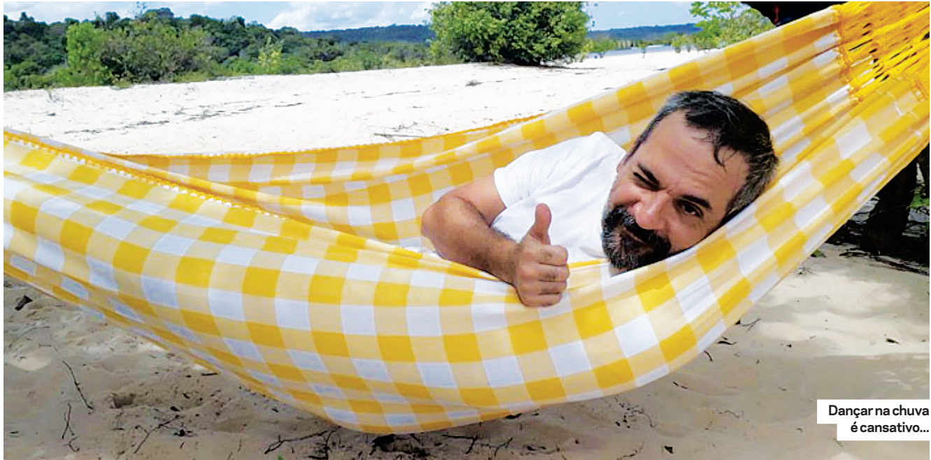
Dançar na chuva é cansativo...