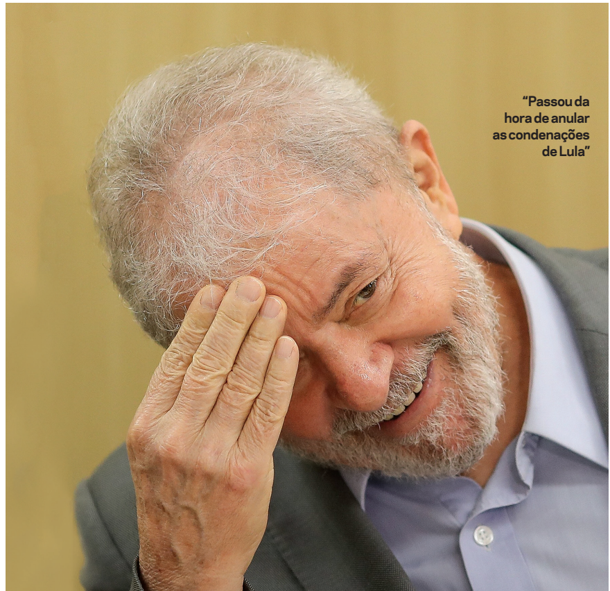
“Passou da hora de anular as condenações de Lula”

FD: É precoce qualquer diagnóstico. Neste momento, deve-se exigir uma investigação técnica, séria e isenta, para que essa história misteriosa seja elucidada. Não por causa dos diálogos vazados, mas pelo fato de a atuação dos hackers ser ilegal, representar uma invasão de privacidade. A investigação desses crimes em nada invalida a divulgação dos diálogos entre o ex-juiz Sérgio Moro e integrantes do Ministério Público. A Constituição garante a liberdade de expressão e o sigilo das fontes. Acho que a apuração começou mal. O ministro da Justiça, que formalmente nada tem a fazer ou a dizer sobre a investigação, revelou uma indevida intromissão ao divulgar não só o acesso a uma apuração que não está sob seu controle, mas a intenção de destruir provas. O Moro praticou mais uma usurpação de função.