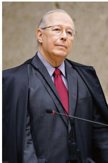
Mello tem tempo para lustrar a biografia

C elso de Mello é o decano do Supremo Tribunal Federal, o mais antigo na casa. Está lá desde 1989, ano da primeira eleição para presidente após a ditadura. A seis meses de pendurar a toga por idade, o juiz de Tatuí, cidade de 120 mil habitantes no interior paulista, tem nas mãos o destino do presidente nostálgico da ditadura e o do homem-chave para a chegada desse saudosista ao poder. O casamento de Jair Bolsonaro e Sérgio Moro terminou em litígio e baixaria, e agora cabe a Mello arbitrar o desenlace. Entre os 2,5 mil processos em seu gabinete, há um inquérito que se propõe a descobrir se o ex-capitão é criminoso comum, por trocar o diretor da Polícia Federal com objetivos pessoais