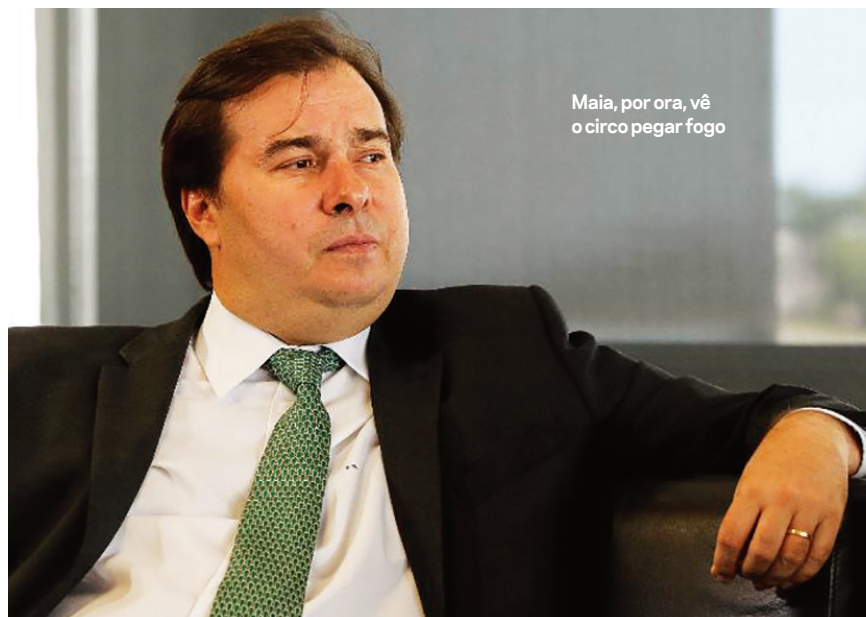
Maia, por ora, vê o circo pegar fogo

Um dos inquéritos que assombram Bolsonaro diz respeito a notícias falsas e