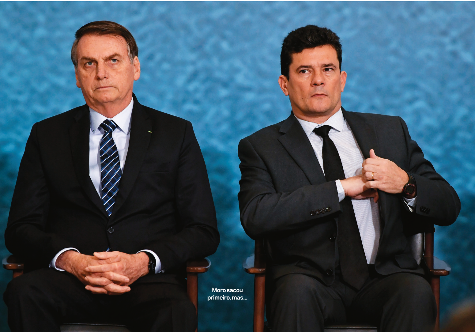
Moro sacou primeiro, mas...

a pressões e pode priorizar a biografia. Como quer entrar para a História ao decidir sobre Moro, que em 2013 considerou “suspeito” em uma ação similar ao HC lulista, e sobre Bolsonaro, alvo de bordoadas verbais suas?