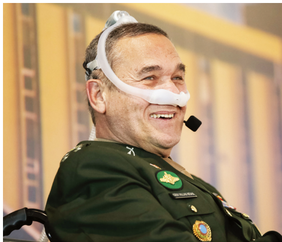
Villas Bôas e outros fardados não largam o osso

Há mais esquisitice na saída de Moro. Ele usou dependências do governo (o auditório do Ministério da Justiça) para atacar o presidente. Sua atitude, chamemos de frieza, foi além. O ex-juiz mostrou à mídia conversas trocadas por celular com uma deputada cujo casamento apadrinhara em fevereiro, Carla Zambelli, bolsonarista radical. “Maligno”, comentou ela. A intenção de Moro era defender-se da acusação de Bolsonaro de que havia resistido à troca de chefe da PF para barganhar uma nomeação ao Supremo. “Não estou à venda”, escreveu à deputada, depois de ela dizer que tentaria convencer o presidente a indicá-lo.