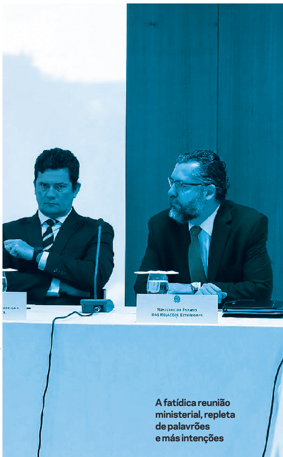
A fatídica reunião ministerial, repleta de palavras e más intenções