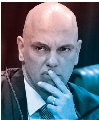
Moraes, o "inimigo" da vez

ALEXANDRE DE MORAES: "NÃO PODEMOS ADOTAR A TEORIA DO APAZIGUAMENTO. NÃO DÁ CERTO"