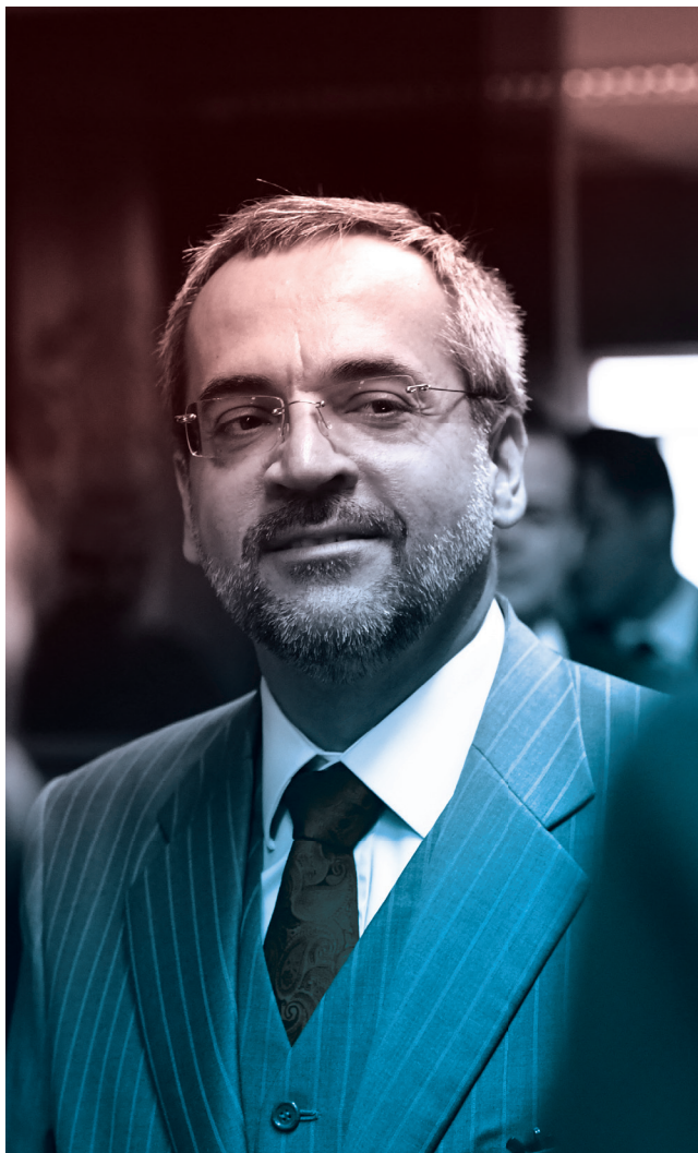
Weintraub ingressou com um pedido de habeas corpus preventivo . Teme ser preso por suas bravatas contra os ministros do STF