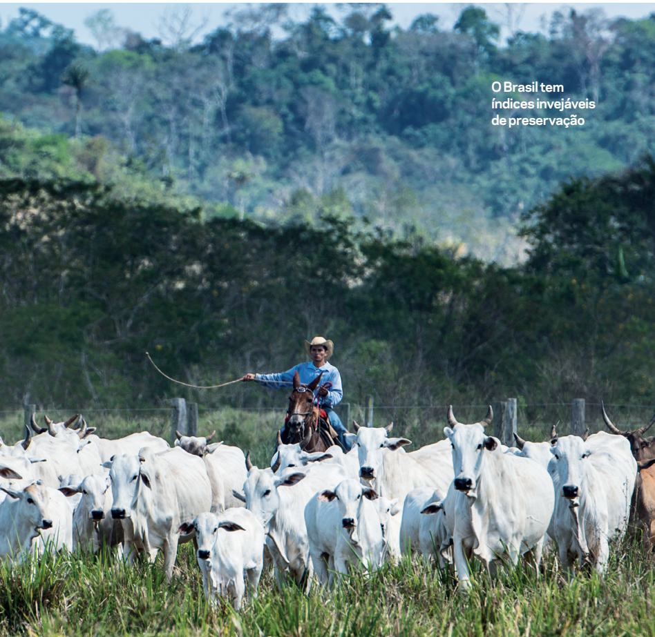
O Brasil tem índices invejáveis de preservação