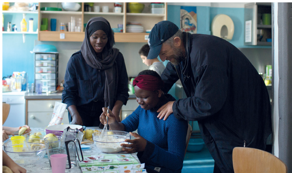
Baseada em fatos reais, a obra de Olivier Nakache e Éric Toledano aborda o autismo de forma delicada e humanista

Nakache e Toledano são especialistas em humor sutil e elegante, uma estratégia inteligente para colocar mais gente em contato com os temas que abordam. Comovente, Mais que Especiais joga luz sobre a questão do autismo – e de resto sobre temas sensíveis como mobilidade, diversidade, tolerância e respeito, em uma obra delicadamente humanista. - Zema Ribeiro