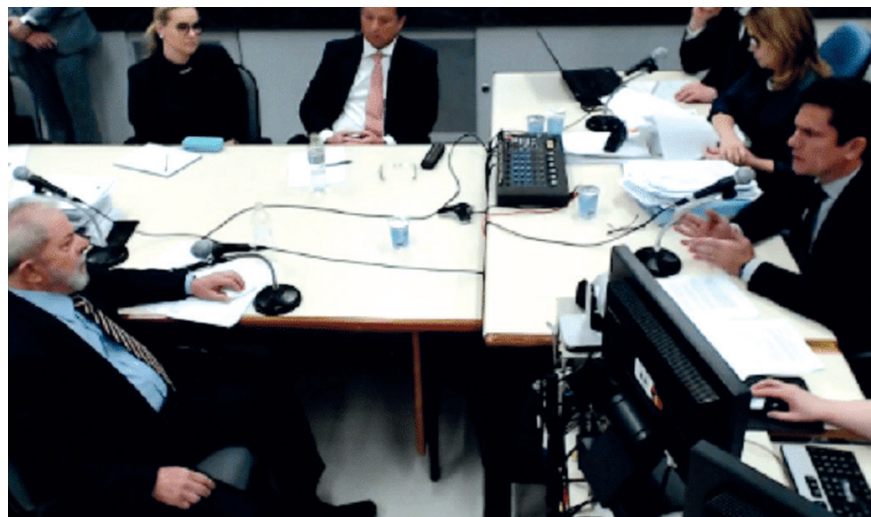
O livro narra como a força-tarefa de Sergio Moro cometeu um oceano de aberrações jurídicas

De Fabiana Alves Rodrigues . WMF Martins Fontes, 2020. 279 páginas, 50 reais.