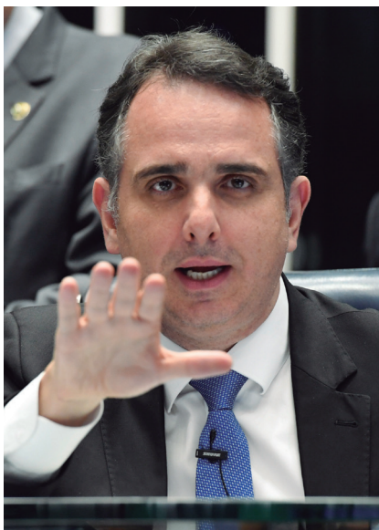
Pacheco é um aliado importante de Lula no jogo bruto do Congresso. Temer cedeu ao “parlamentarismo à brasileira”