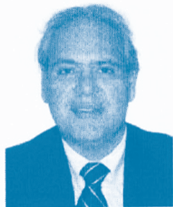
PP O ex-ministro de Collor ganhou um contrato

Mas a trama em torno das centrais energéticas envolve mesmo é um contrato simulado. Por meio de uma de suas empresas de fachada, a MO Consultoria, Youssef recebeu 4,3 milhões de reais da Investminas. Segundo o ex-ministro de Collor, tudo